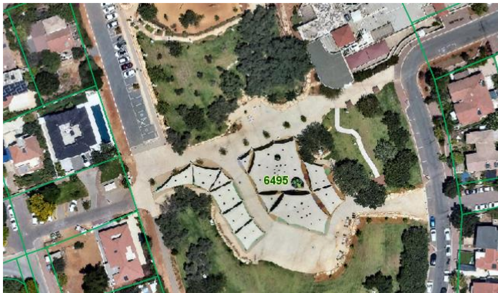
גינת ששת הימים :